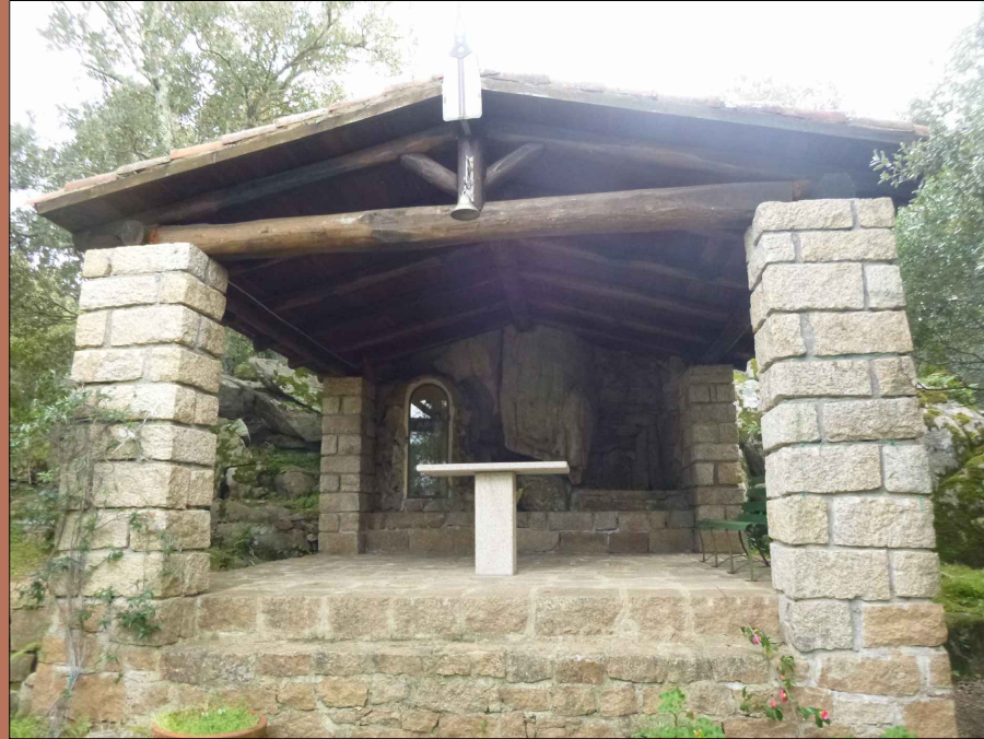
Cappella campestre di S.Giuseppe

L'intervento è funzionale alla conservazione e alla ricostruzione della relazione, in termini di rispetto ambientale, tra i centri urbani e l'agro, tra la vocazione turistica e la fruizione del territorio interno, con la creazione di una fascia a verde di riqualificazione in termini generali dell'abitato residenziale, attraverso la connessione di percorsi alberati, aree verdi e spazi di relazione da vivere con finalità sportive, sociali e ricreative.