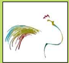
TAVOLA ESPLICATIVA DEGLI OBIETTIVI E DELLE IDEE PROGETTUALI