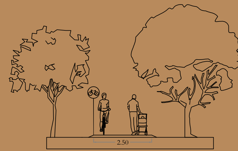
Sezione tipo della viabilità ciclopedonale

Il Progetto, mediante la realizzazione di una adeguata viabilità interna di accesso e penetrazione, consente di organizzare e regolamentare la viabilità, la sosta e l'accesso per la fruizione turistico-ricreativa delle aree, in relazione alla vulnerabilità e sensibilità ambientale del sistema e nel rispetto delle componenti formali e strutturali del paesaggio. La realizzazione di un "percorso vita" e di aree per il jogging forniranno una irrinunciabile alternativa alla diffusa pratica sportiva lungo le strade provinciali