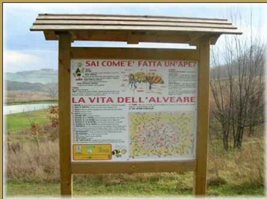
Esempio di Cartello esplicativo delle aree didattiche

La realizzazione della rete dei Parchi consentirà di riqualificare aree degradate ai confini tra agro e urbano mediante l'individuazione di spazi pubblici collettivi, interpretati come zone di transizione, anche in rapporto ai corridoi fluviali, e di collegamento ecologico tra urbano e paesaggio. Il Parco inoltre, attraverso la realizzazione di spazi verdi progettati secondo una prospettiva ecosostenibile e didattica, ricostruisce il rapporto fra l'edificato urbano e l'agro e arricchisce le esperienze della popolazione residente nei confronti del paesaggio circostante. Il Parco si articolerà in percorsi e isole didattiche orientate alla rievocazione storica delle esperienze, delle tradizioni e degli usi tipici dei luoghi.