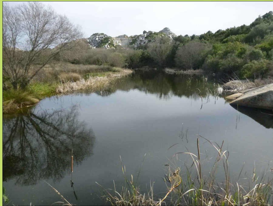
Scorcio dello specchio d'acqua a Lu Lioni

L'intervento consentirà di ripristinare gli equilibri alterati da usi impropri del territorio e, mediante un sistema di accesso e fruizione regolamentato (percorsi obbligati, passerelle, isole didattiche, valorizzazione delle specie vegetali autoctone, punti di osservazione, ecc.) di riportare l'ecosistema a un grado di naturalità più alto. La realizzazione di passerelle e pedane in legno consentiranno l'avvicinamento alle aree più vulnerabili nel rispetto della specifica sensibilità ambientale.